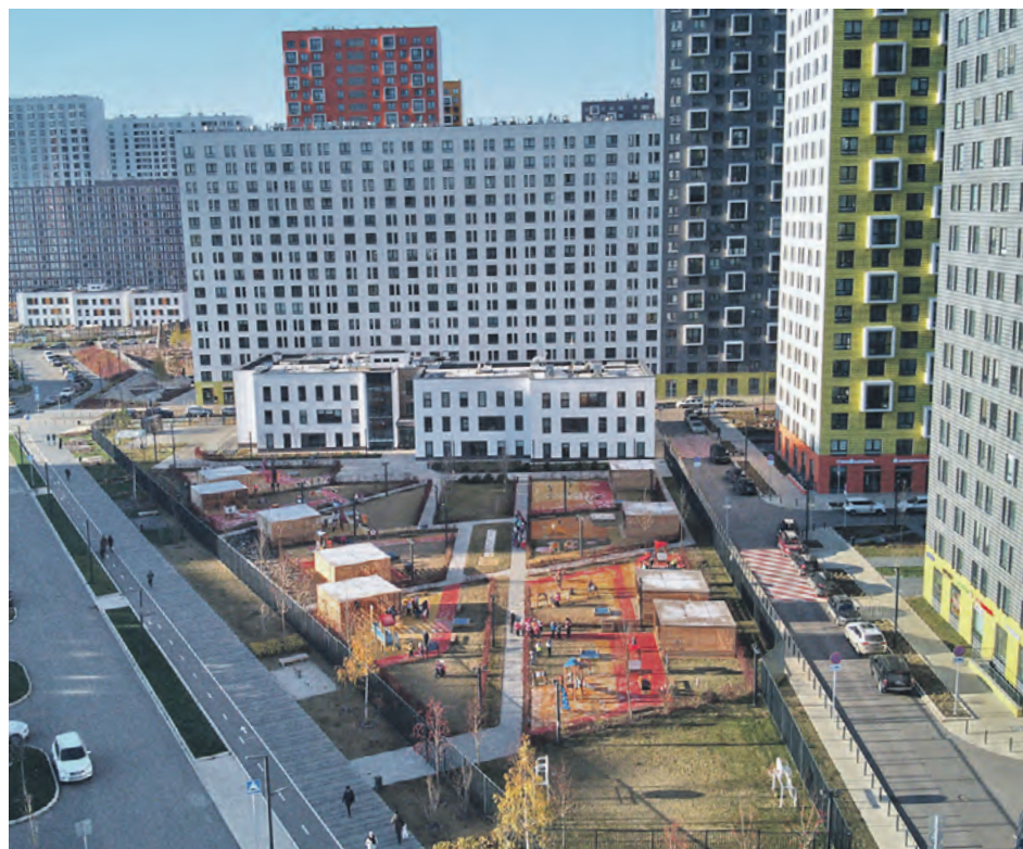
Новая Москва разрастается все больше и больше. С момента присоединения ТиНАО к столице здесь введено в эксплуатацию 32,6 млн кв. м недвижимости. Более 25 млн кв. м общего объема составляет жилье.