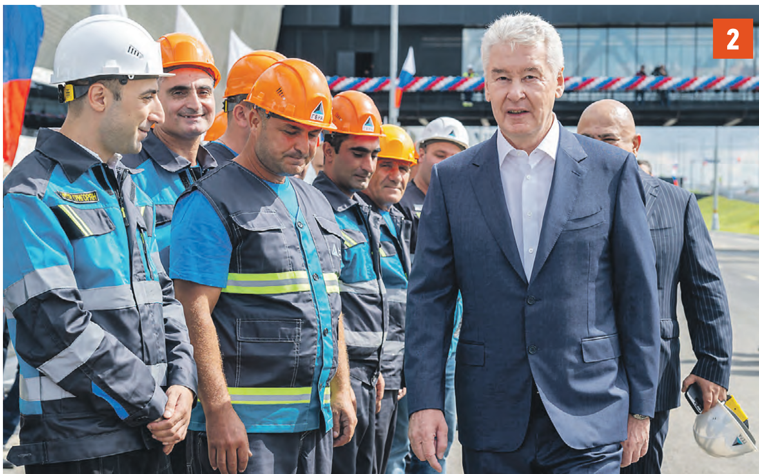
МОСКВА 9 августа. Мэр Москвы Сергей Собянин рассказал о скором открытии станции «Потапово» Сокольнической линии, а также открыл новый участок Солнцево — Бутово — Варшавское шоссе