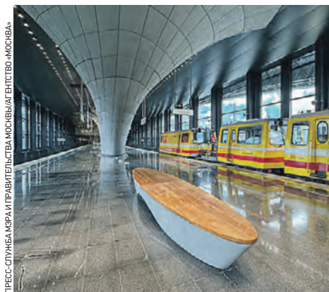
Новая станция уже ждет первых пассажиров, которые появятся здесь в сентябре

— «Потапово» станет первой отапливаемой наземной станцией московского метро. Подавать теплый воздух будет вентиляционное оборудование, — отметил мэр.