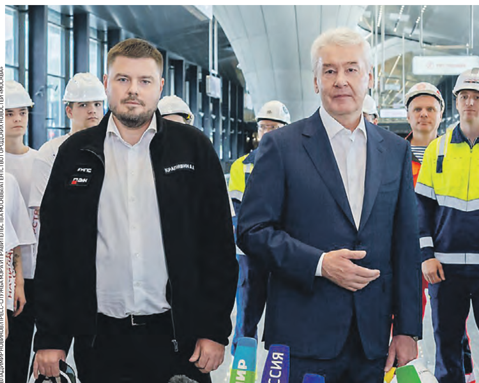
9 августа. Мэр Москвы Сергей Собянин и генеральный директор ОАО «Дороги и мосты» Алексей Крапивин (слева) провели технический пуск станции «Потапово»