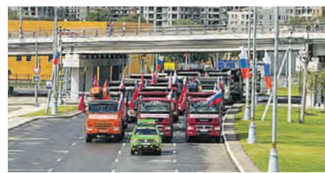
Участок трассы Солнцево-Бутово-Варшавское шоссе открыт