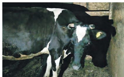
Буренка Кнопка после счастливого спасения из ямы

Подготовила Евгения Степаненко newokruga@vm.ru