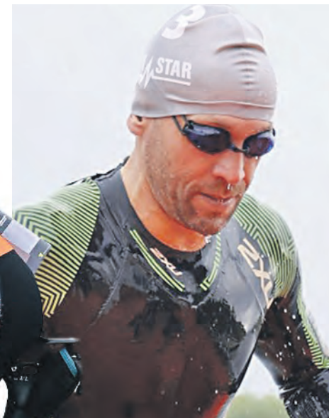
Троицкий спортсмен после плавательного этапа