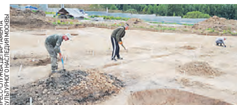
Археологи во время работы в Краснопахорском районе