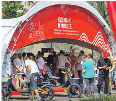
Программа «Сделано в Москве» привлекает бизнесменов

Город оказывает производителям самую разную поддержку — от рекламы до выставок. Столичные компании представлены на платформе sdelanovmoscow.ru . За год онлайн-шоурум посетили больше двух миллионов уникальных покупателей. Программа открыта для любого бизнеса и даже для самозанятых.