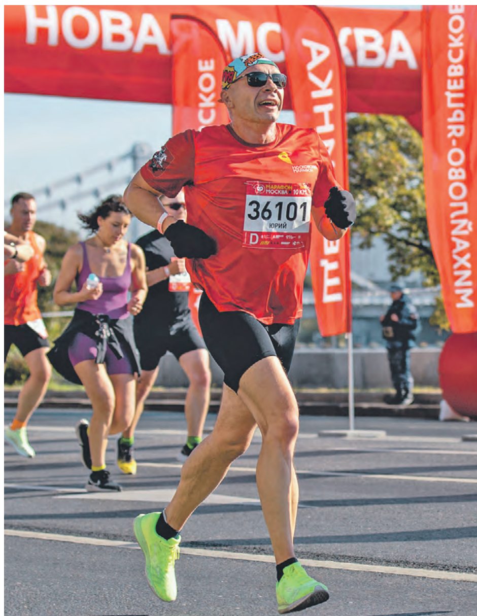
Московский марафон собрал любителей бега. Спортсмены испытали свои силы в дистанциях на 10 и 42,2 километра

Марафон — это не только о том, как бежать, но и с кем. В компании едино-