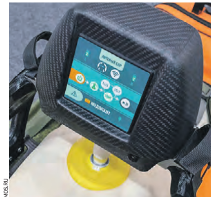
Разработка серьезно поможет увеличить процент выживаемости пациентов

— Система делает непрямой массаж сердца, освобождая медикам руки для проведения других манипуляций при спасении людей, — написал мэр Москвы Сергей Собянин в своем телеграм-канале. Специалисты считают, что разработка увеличит процент выживаемости пациентов и повысит качество медпомощи. У аппарата нет аналогов в России и есть ряд преимуществ по сравнению с зарубежными системами. В ближайших планах компании — дистанционно связать эту систему с аппаратом ИВЛ.