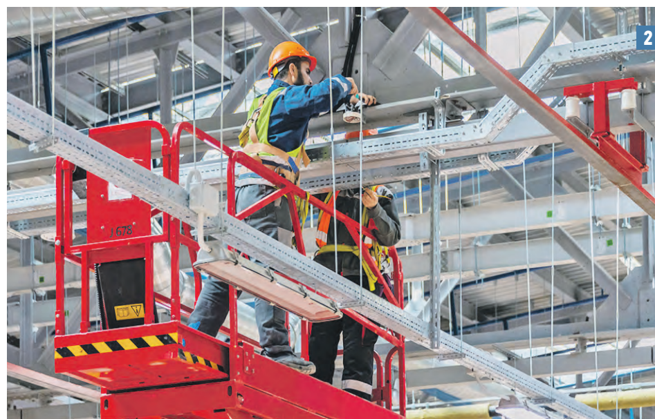
26 октября 2022 года. Мэр столицы Сергей Собянин и заместитель гендиректора компании-подрядчика Янис Карибов (1) осмотрели ход работ в электродепо «Нижегородское» (2) Всего три электродепо будут обслуживать Большую кольцевую линию

самого поселка Воскресенское теперь получили прямую связь со станцией МЦД-2 Щербинка и с социальными объектами в поселке Воскресенское.