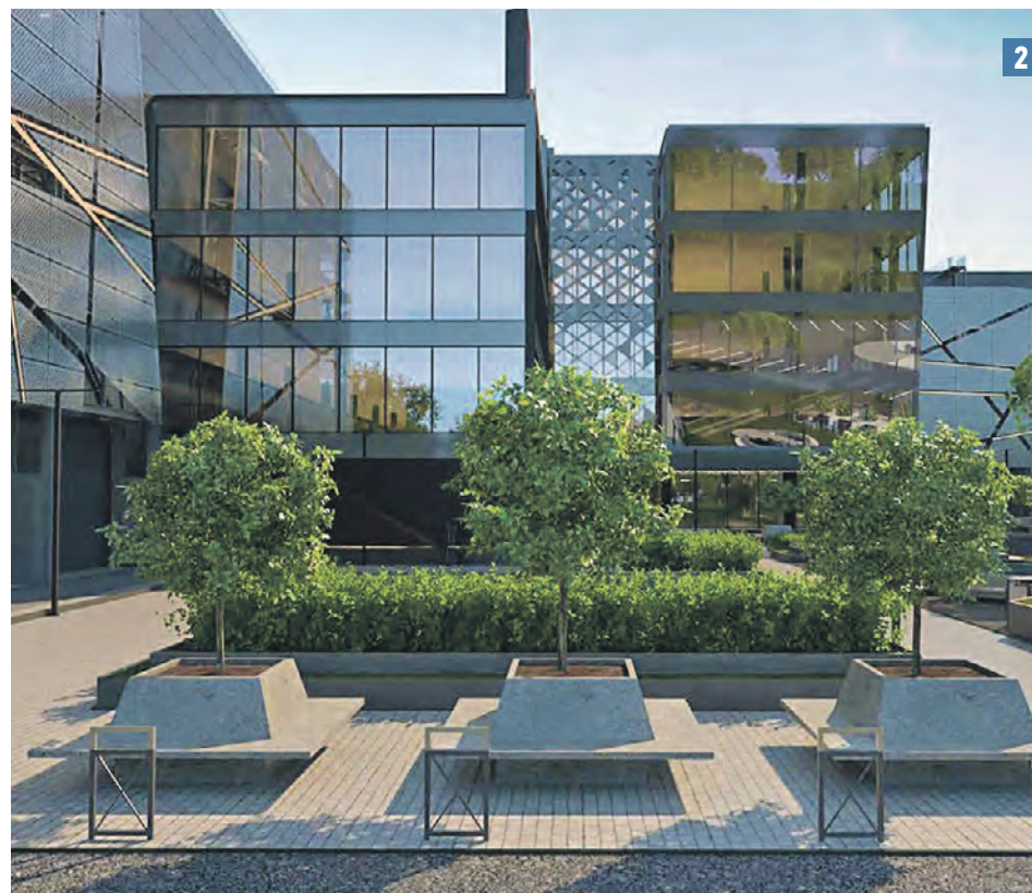
Сосенское. Образовательный центр «Холст» (1,3) скоро сможет принять жителей поселения. Вороновское. Роботизированный архив стал самым большим в России (2). Работы вышли на финишную прямую