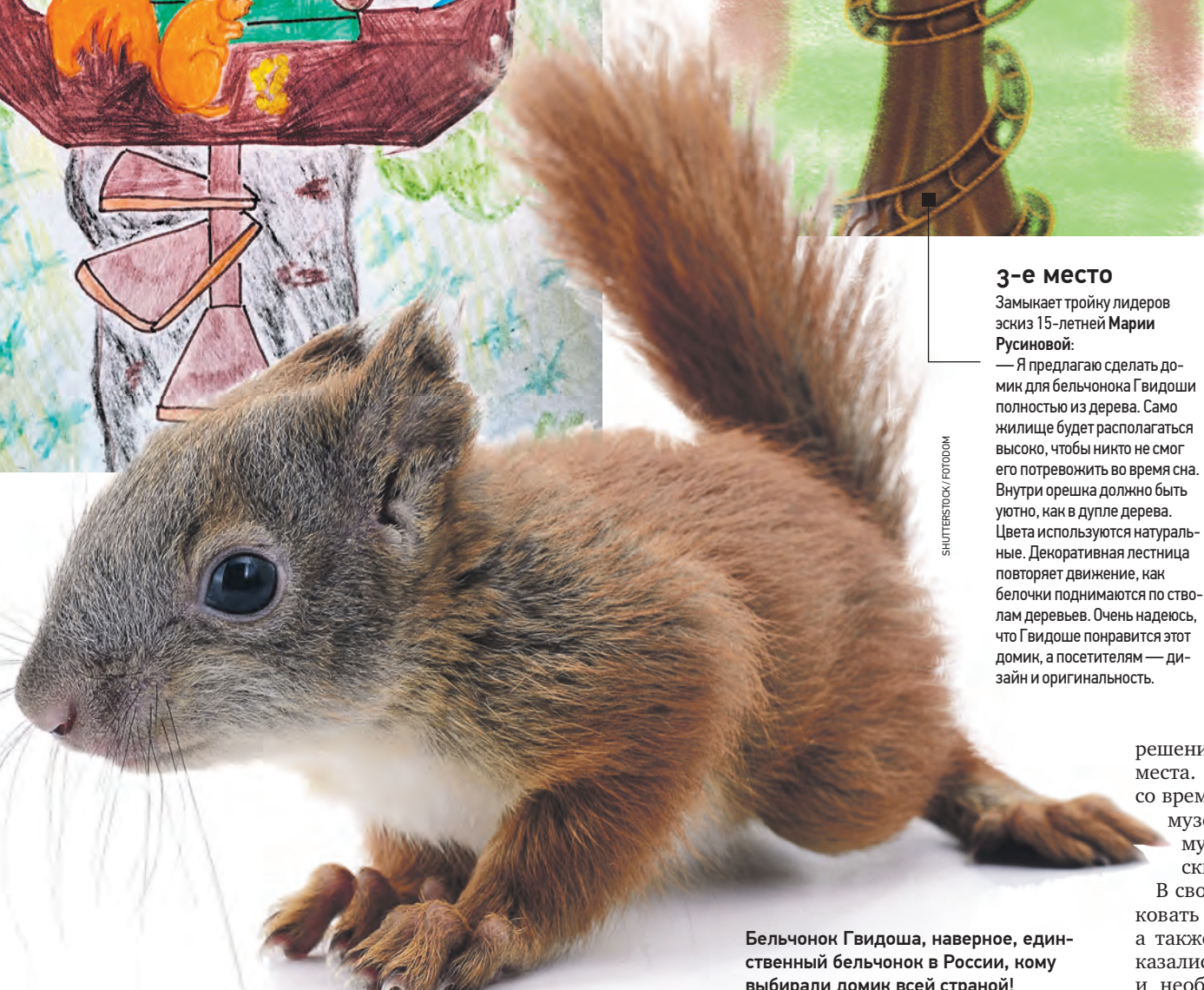
Бельчонок Гвидоша, наверное, единственный бельчонок в России, кому выбрали домик всей страной!