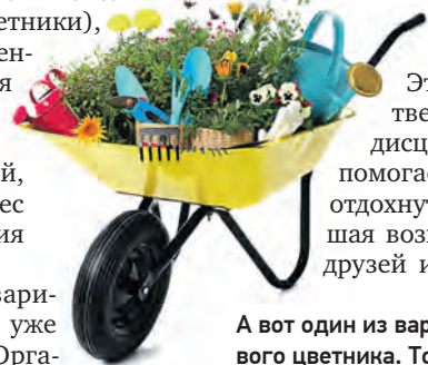
А вот один из вариантов необычного садового цветника. Также красиво!

различных лет и архитектурных стилей, вертикальные цветочные композиции, цветочные скульптуры, уникальные, современные или традиционные садовые композиции (цветники), творческий экспериментальный ландшафт для городского оформления, редкие или новые виды и сорта цветов и растений, представляющие интерес для городского озеленения или широкой публики. Жители деревень Варварино, Чириково, Красное уже прислали свои работы. Орга-