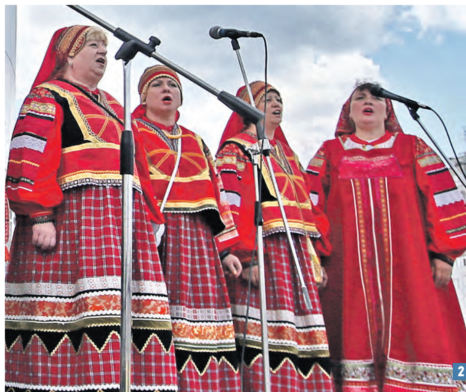
1 июня 2017 год. Киевский. Празднование пятилетия ТиНАО. Первый Узловой уровень международных игр «Спорт поколений» (1), а также музыкальный фестиваль «Новая Москва» (2)

Мероприятие начнется в 12:00, напротив дома культуры для детей установят батуты, аппараты со сладкой ватой, попкорном и мороженым. С 16:00 для жителей и гостей Воскресенского проведут мастер-классы по аквагриму, мягкой игрушке, рисованию и многому друго-