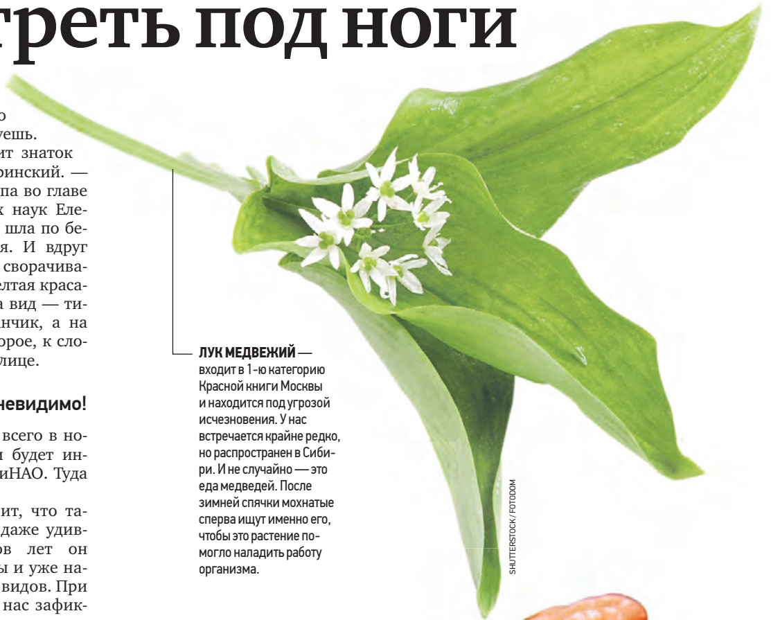
ЛУК МЕДВЕЖИЙ — входит в 1-ю категорию Красной книги Москвы и находится под угрозой исчезновения. У нас встречается крайне редко, но распространен в Сибири. И не случайно — это еда медведей. После зимней спячки мохнатые сперва ищут именно его, чтобы это растение помогло наладить работу организма.