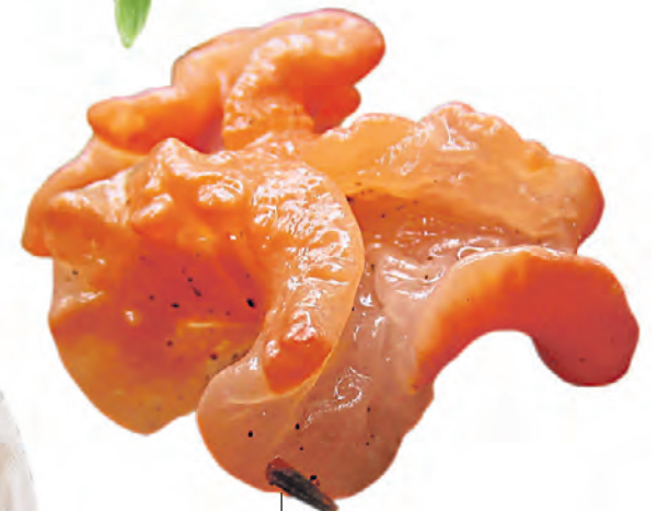
КРАТЕРОКОЛЛА ВИШНЕВАЯ — гриб включен в третью категорию Красной книги Москвы. Для человека также считается несъедобным.