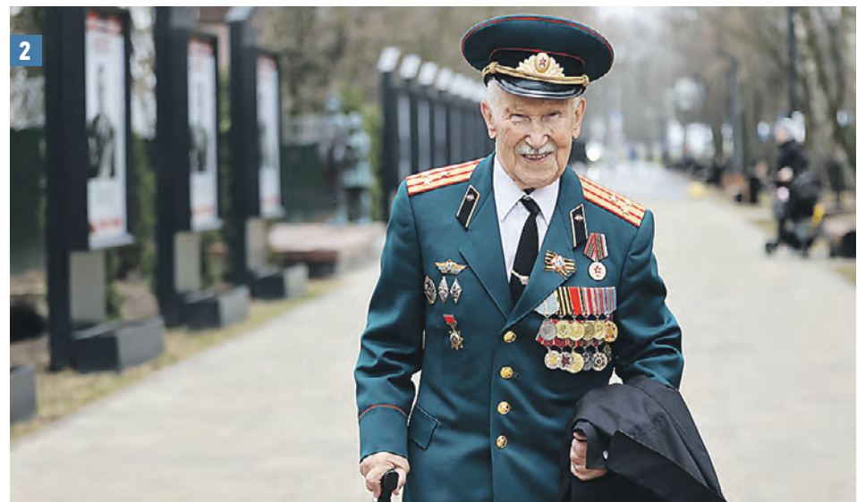
маршрута колонны стал Парк Победы в селе Красная Пахра. Здесь, у мест боевой славы, состоялся торжественный митинг с участием префекта ТиНАО и главы поселения Краснопахорское. Они по-