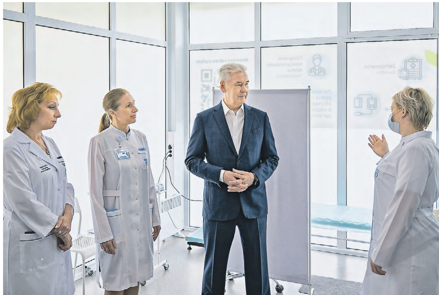
11 мая 2022 года. Мэр Москвы Сергей Собянин на открытии павильона «Здоровая Москва» на Ходынке

— Во время COVID-19 около миллиона человек получили вакцинацию именно в павильонах «Здоровая Москва», — отметил Сергей Собянин. — Это было такое хорошее подспорье. Без этого вряд ли бы мы справились с такой глобальной задачей. Мэр подчеркнул: сегодня для медиков поставлена новая задача — в первую очередь провести диспансеризацию тех, кто переболел COVID-19. Москвичи, которые переболели коронавирусом, смогут принять участие в дистанционном опросе, по результатам которого получат информацию