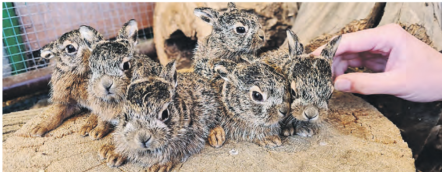
10 мая 2022 года. Внуковское. Специально для малышек огородили территории во дворе школы № 1788

Сотрудники школы, увидев такую необычную картину, даже место проживания маленьких хвостиков специально огородили. И вмешиваться в их воспитание и взросление вообще не планировали. А вскоре поняли: если школа для детей опасности не представляет, то вот для зайчат она может стать местом не самым благополучным. Детский сад, постройка, дороги — не к такому месту обитания привыкли эти животные. Поэтому работники школы на всякий случай вызвали специалистов из Центра реабилитации диких зайцев, чтобы про-