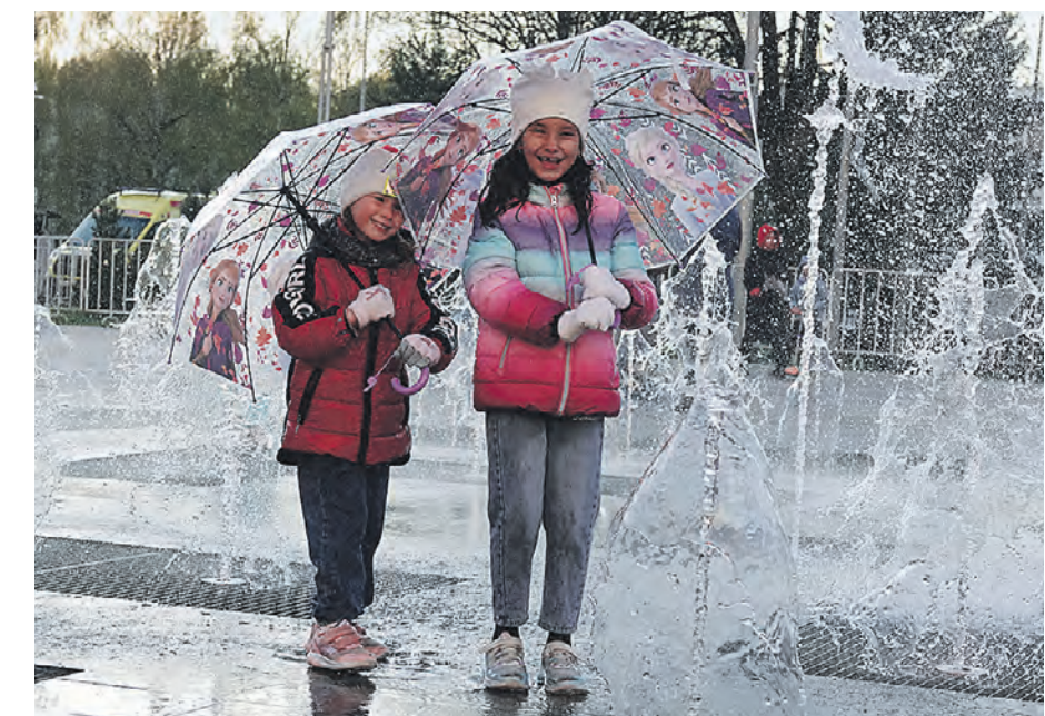
9 мая 2022 года. Московский. Все-таки между маленькими струйками воды девчонкам пробраться удалось. Зонтики взяли специально, чтобы не намочить. И, как ни странно, вышли из воды почти сухими