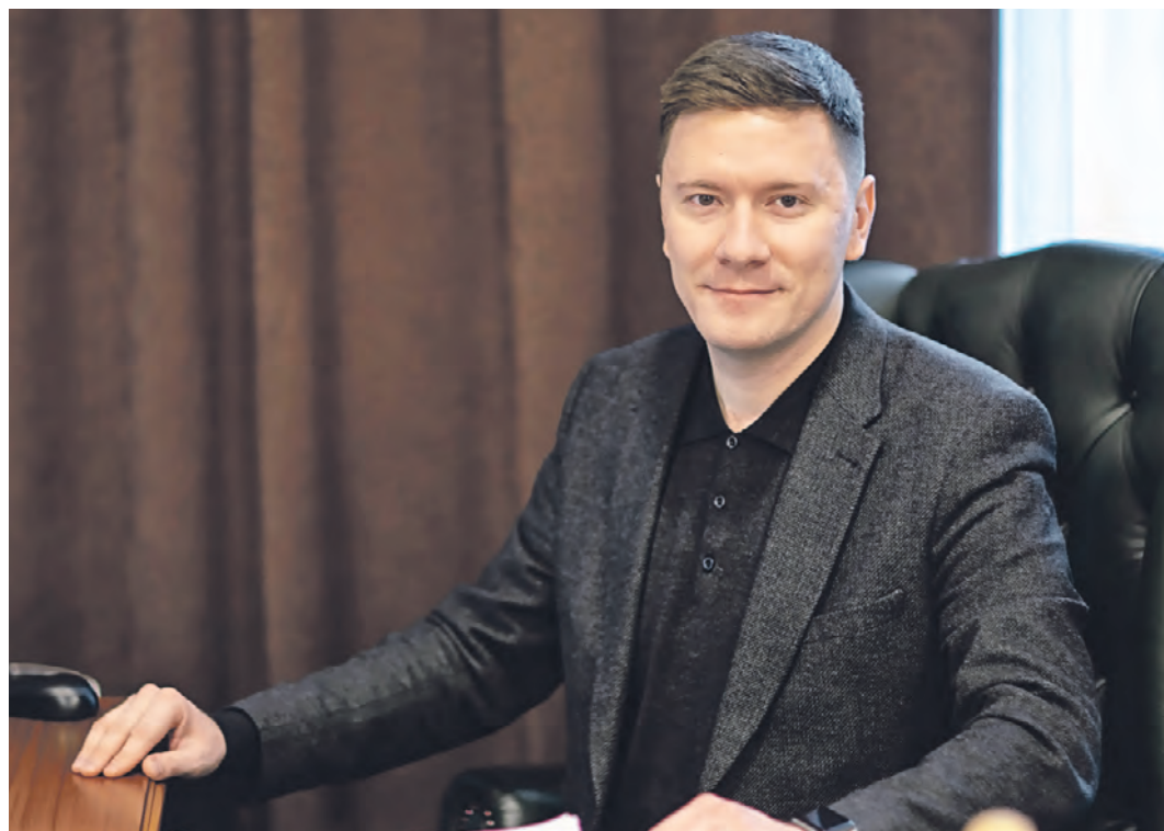
Депутат Мосгордумы Александр Козлов