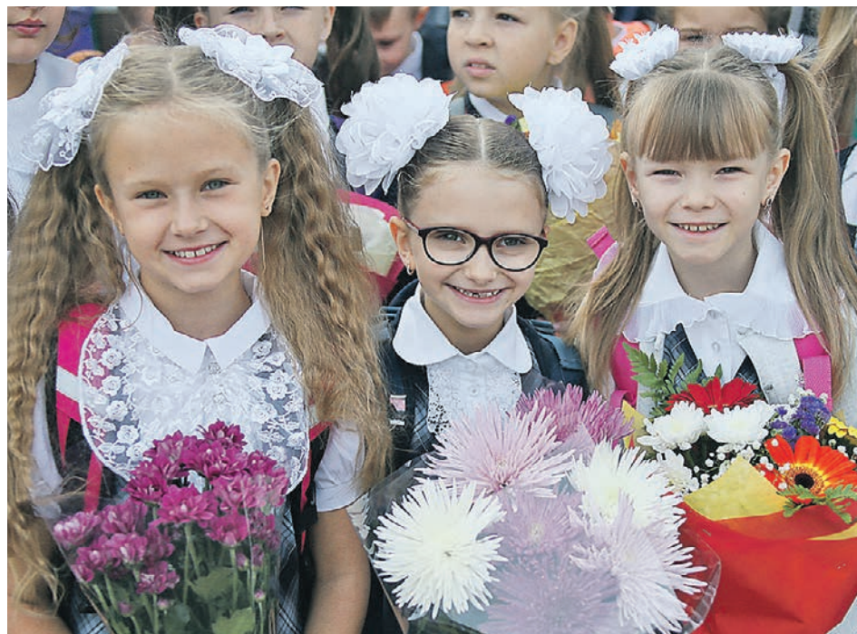
1 сентября 2020 года школы Новой Москвы приняли 52 тысячи учеников. В этом году благодаря появлению новых корпусов учащихся в ТиНАО станет еще больше

Планируется открытие школы и для жителей ЖК «Москвичка» и близлежащих населенных пунктов. Наряду с обычными классами в ней оборудуют кабинеты для занятий кулинарией, обработки металла и дерева. А рядом с жилым комплексом «Белые ночи» появится школа, которая станет настоящим образовательным центром. Здесь ученики смогут постигать азы ис-