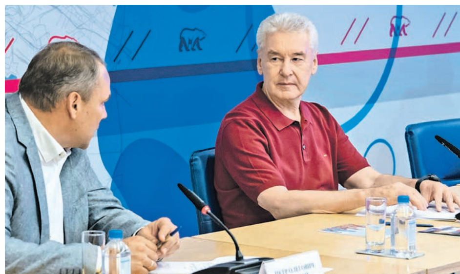
17 июля 2021 года. Москва. Лидер московского списка «Единой России» Сергей Собянин и секретарь столичного регионального отделения партии Петр Толстой