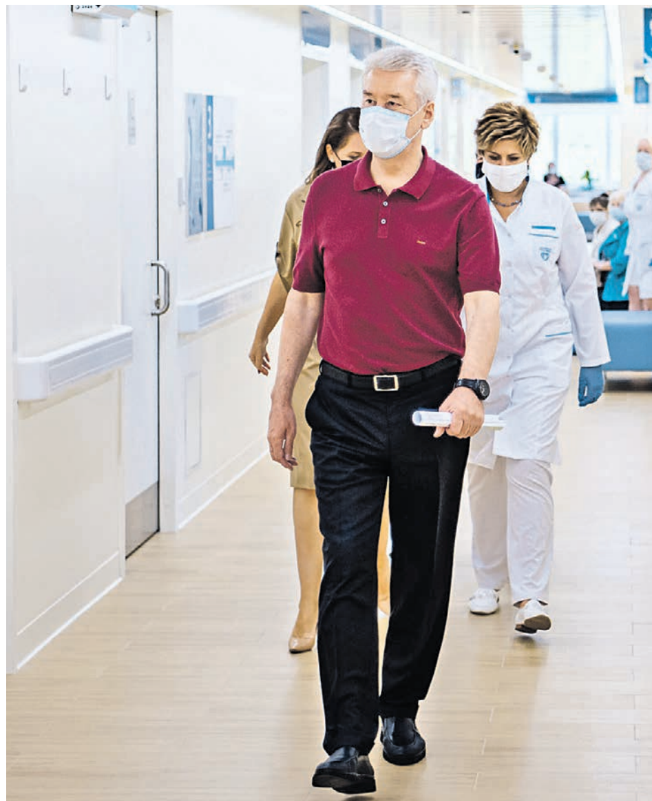
26 июля 2021 года. Мэр Москвы Сергей Собянин во время посещения филиала № 1 городской поликлиники № 9 в районе Кузьминки, открывшегося после реконструкции

— Проект планировки предусматривает строительство крытого надземного перехода с пассажирским вестибюлем на станции «Серп и Молот», который оборудуют лифтами, эскалаторами, турникетами и кассами, — сообщили в пресс-службе мэра и правительства столицы. Кроме того, реконструируют надземный пешеходный переход на станции МЦД-2 «Москва-Товарная» и подземный — на станции «Калитники». Для жителей оборудуют дополнительные наземные пешеходные переходы и светофоры.