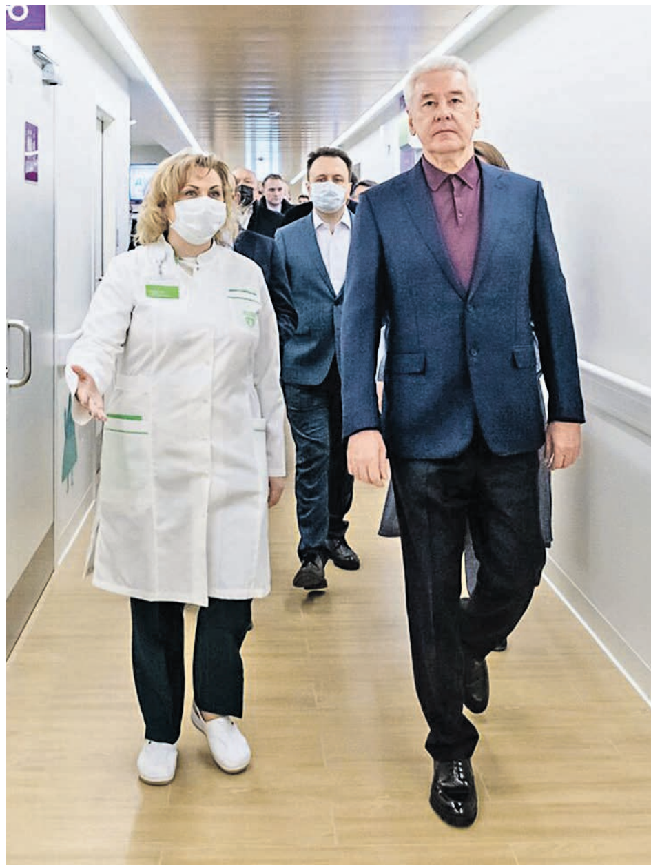
1 марта 2021 года. Мэр Москвы Сергей Собянин и главный врач детской поликлиники № 58 на открытии филиала № 2 медучреждения после напремонта

В Москве возобновили работу два бесплатных коворкинга для малого и среднего бизнеса, расположенные в центрах услуг для бизнеса ЦАО и ЮАО. Там можно получить консультации, узнать о мерах поддержки и подготовить документы для регистрации бизнеса.