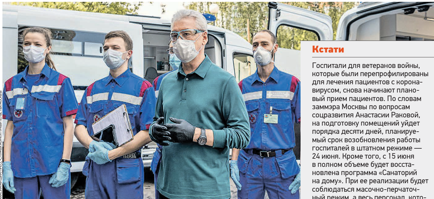
9 июня 2020 года. Мэр Москвы Сергей Собянин с медперсоналом подстанции скорой помощи № 17. Бригады медиков уже получили новые современные машины, оснащенные необходимым оборудованием