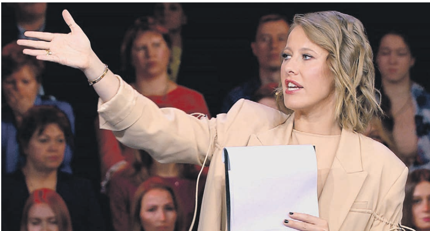
ПРЕСС-СЛУЖБА ПЕРВОГО КАНАЛА

«Новые округа» продолжают рубрику, где мы рассказываем о самых интересных программах и фильмах, которые вы сможете увидеть на неделе.