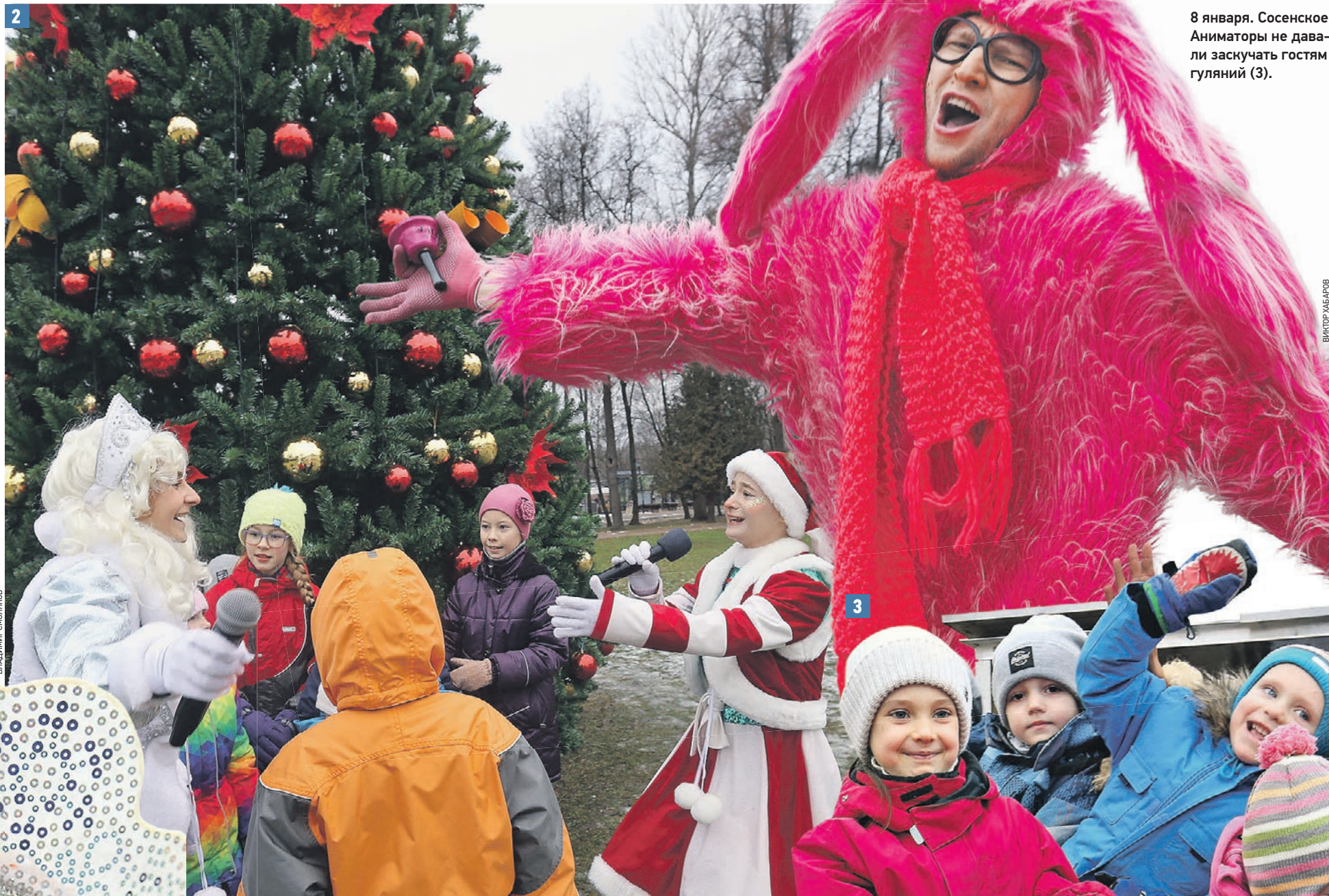
8 января. Сосенское. Аниматоры не давали заскучать гостям гуляний (3).

3 января. В музее-усадьбе «Остафьево» — «Русский Парнас» устроили новогодние каникулы! С песнями и хороводами. И не только для детей, но и для взрослых (2).