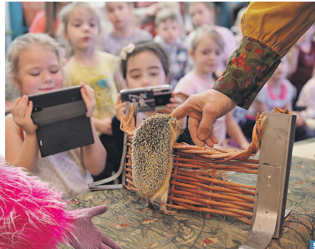
5 января. Филимонковское. В библиотеке № 262 гости смотрели мультики, участвовали в мастер-классах и даже попали на шоу дрессированных ежей (5), которым не страшны никакие преграды.