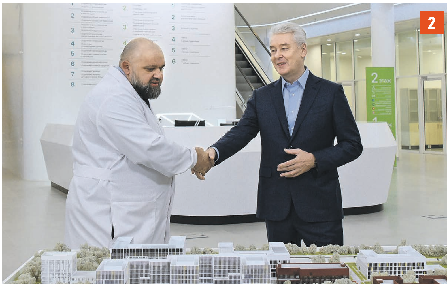
СОСЕНСКОЕ 27 декабря 2019 года. Мэр Москвы Сергей Собянин вместе с главным врачом больницы в Коммунарке Денисом Проценко отметили, что новый медкомплекс сможет предоставлять услуги на мировом уровне