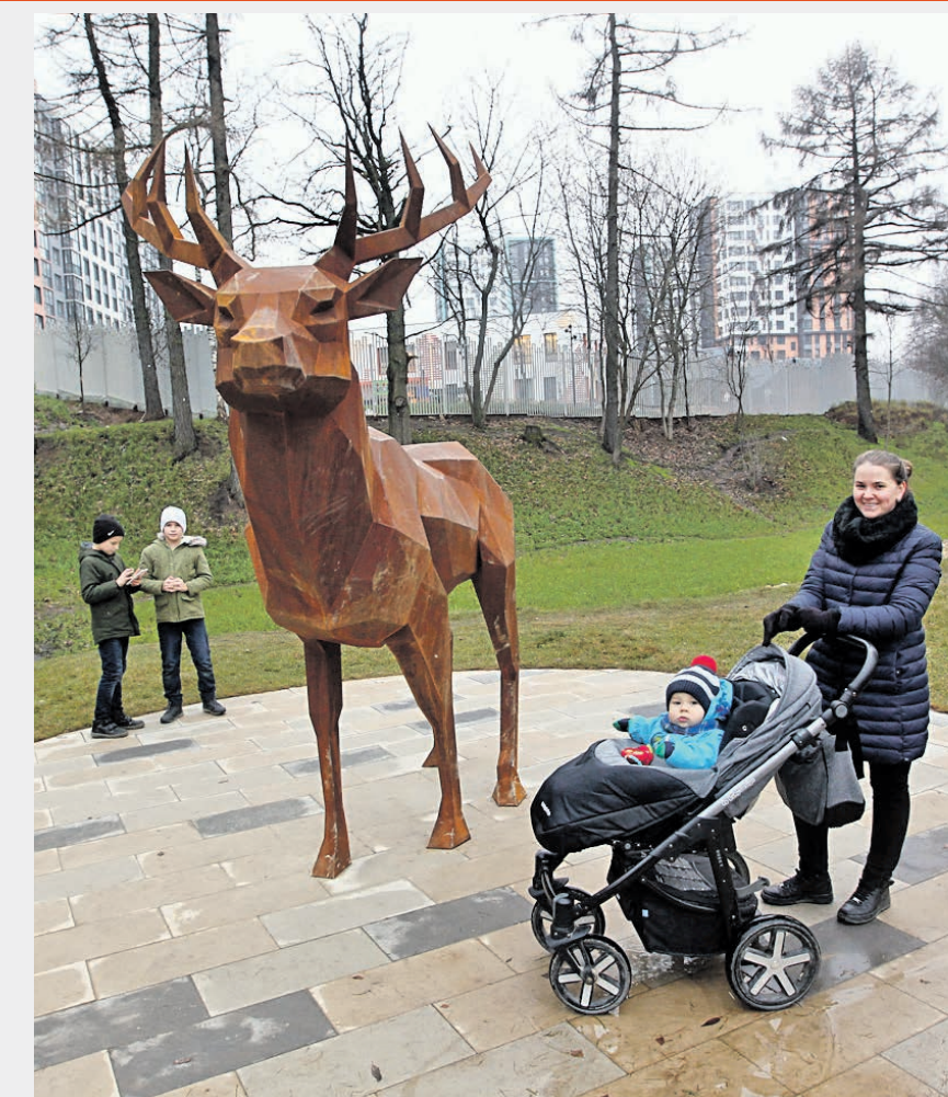
8 ноября 2019 года. Скульптура оленя высотой три метра, появившаяся в парке «Скандинавия», попала в объектив Светланы Сивохо. Жители Коммунарки нарекли лесного зверя хранителем парка и с удовольствием фотографируются рядом с ним