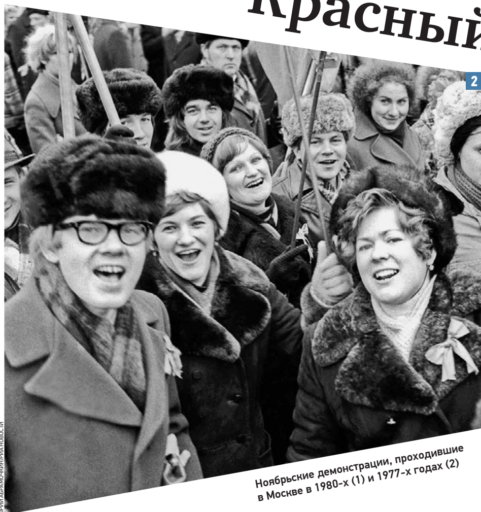
Ноябрьские демонстрации, проходившие в Москве в 1980-х (1) и 1977-х годах (2)

сада рассказывали, что такое революция и кто такой Ленин. Кроме того, выходные дни всегда запоминаются, каким и было 7 ноября. Из нынешнего поколения о нем будут помнить либо сторонники коммунизма, либо его противники, — говорит социолог. — Остальные и не вспомнят.