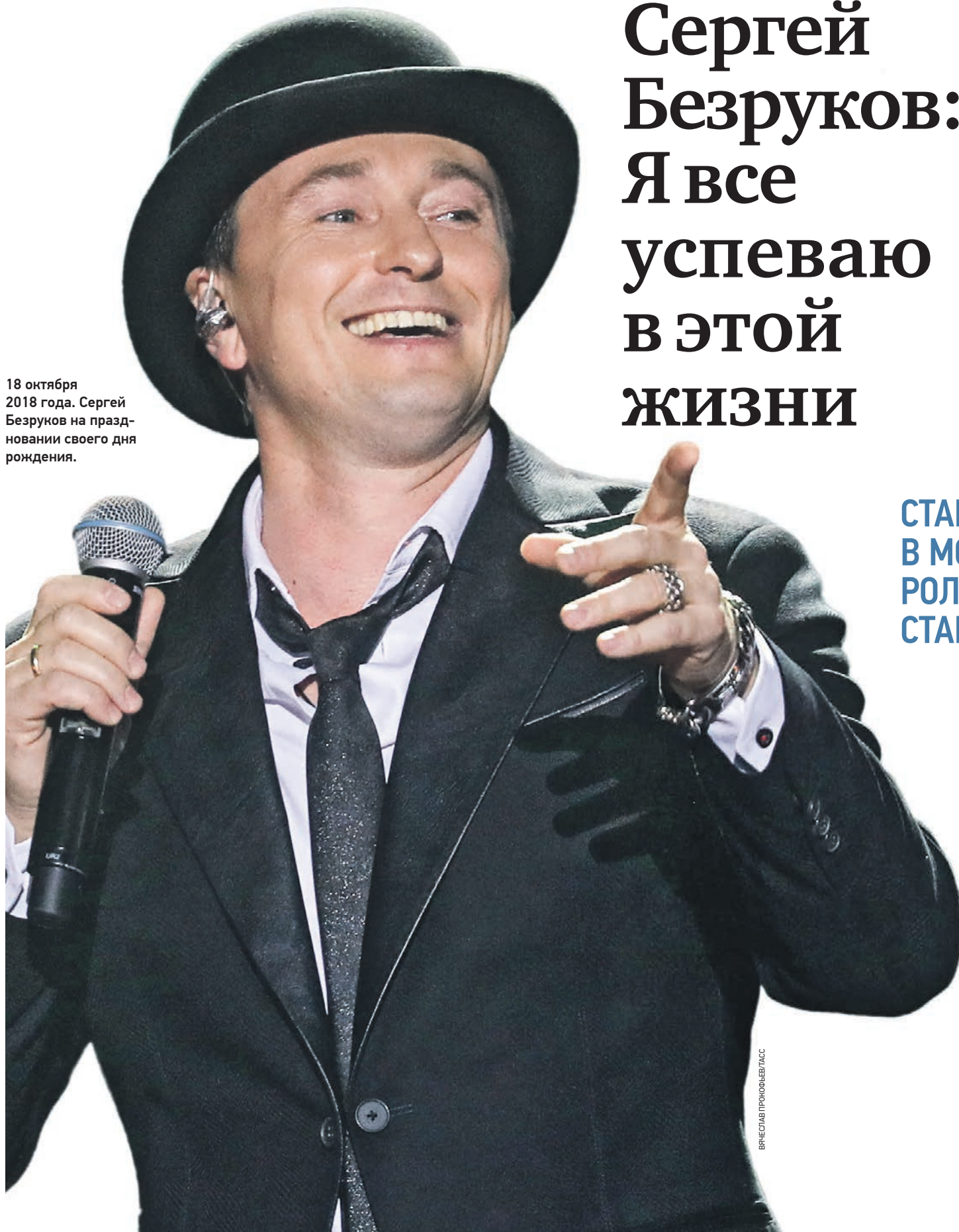
18 октября 2018 года. Сергей Безруков на праздновании своего дня рождения.