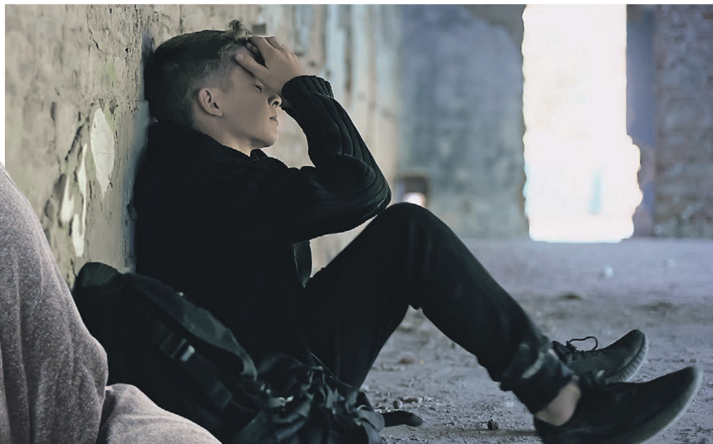
Современным детям явно чего-то не хватает. Иначе как объяснить то, что они не сидят дома, а ищут опасные приключения.

стать настоящей феей Винкс». В последней несмысленной глупышке от лица «Директора школы фей» дают разные задания, выполнив которые можно-де проснуться волшебницей. И если сбор прозрачных камушков или заклинание при свете полной луны никакой особой опасности не несут (если, конечно, камушки — не из ближайшего «Ювелирного», а заклинание творится в собственной комнате, а не на глухом пустыре), то задания из серии «Когда почувствуешь, что у тебя пропала крыльцо, попробуй на них полетать» или «Включи конфорки на плите и отправляйся спать — утром волшебный газ сделает тебя феей» выглядят, мягко говоря, уже не так невинно. Ситуация усугубляется еще и тем, что все эти задания раздаются в закрытых чатах, что добавляет