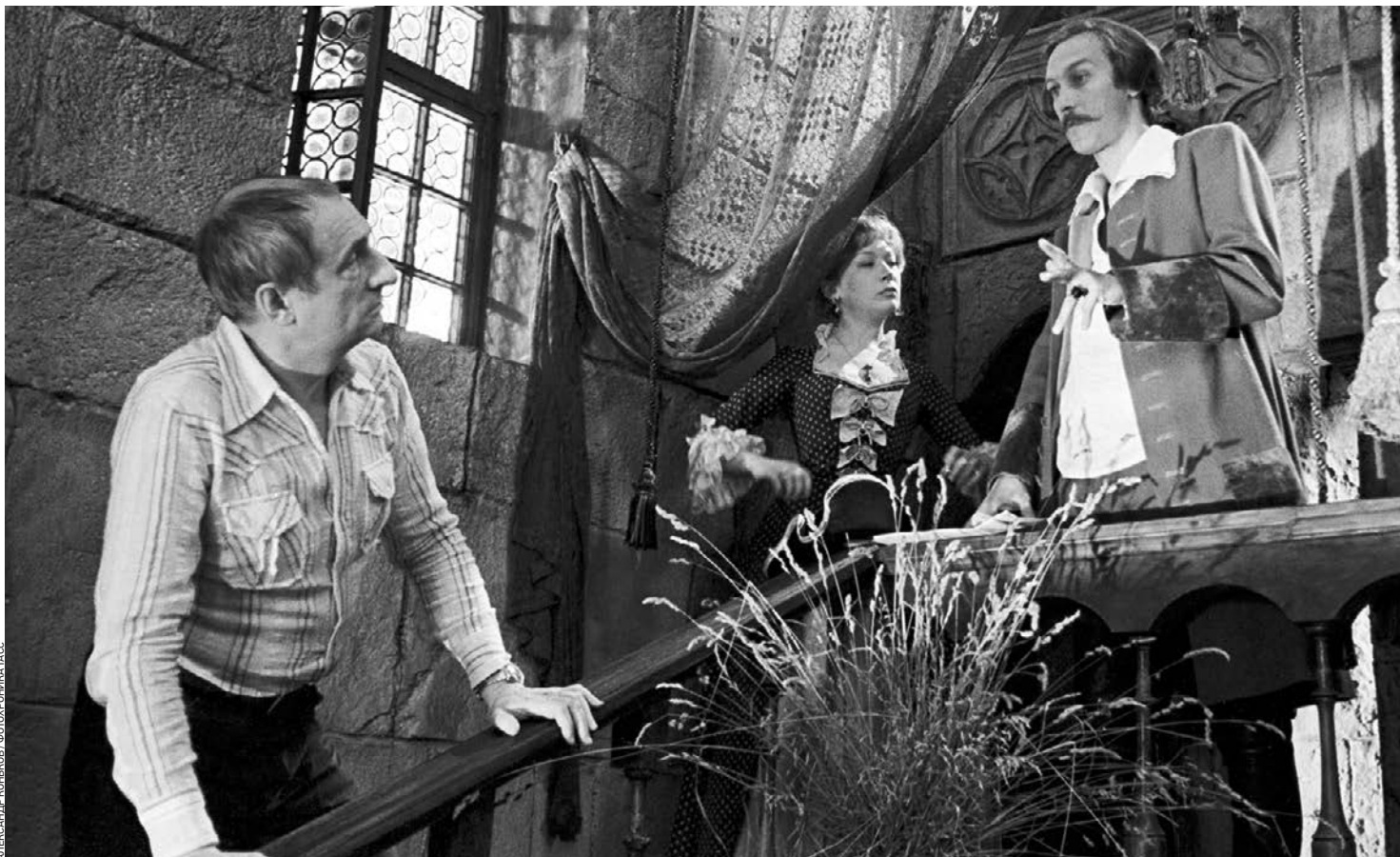
1979 год. Германия. Город Вернигерод. Марк Захаров, Олег Янковский и Елена Коренева во время съемок фильма «Тот самый Мюнхгаузен». Кстати, первоначально на роль Марты, возлюбленной барона, пробовались другие актрисы. Например, Татьяна Догилева и Ирина Мазуркевич. Но режиссер в итоге утвердил именно Кореневу.