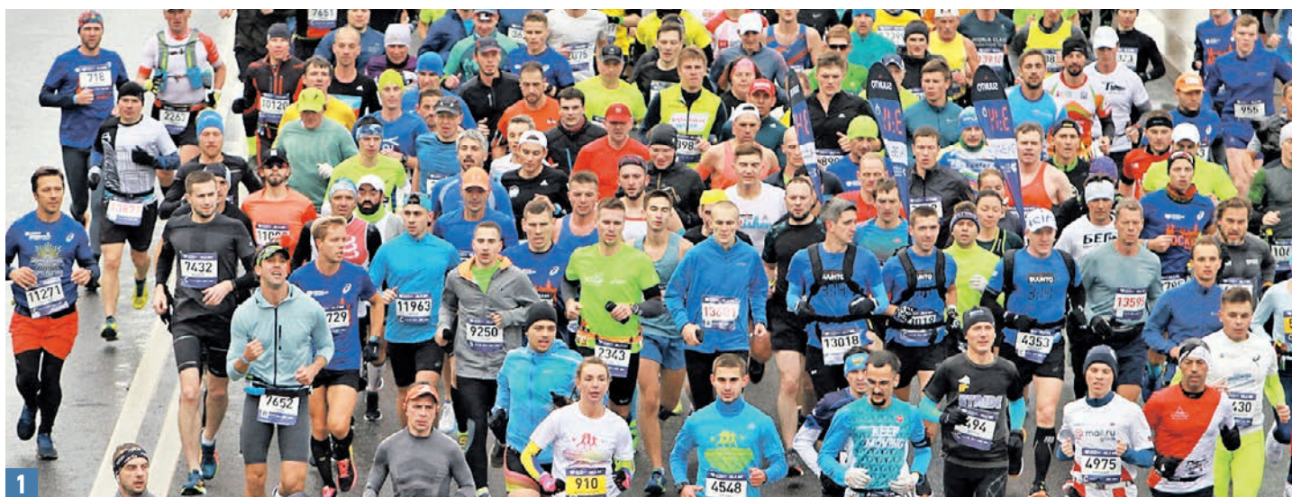
22 сентября 2019 года. Свыше 30 тысяч человек вышли на забег, несмотря на непогоду (1, 2).