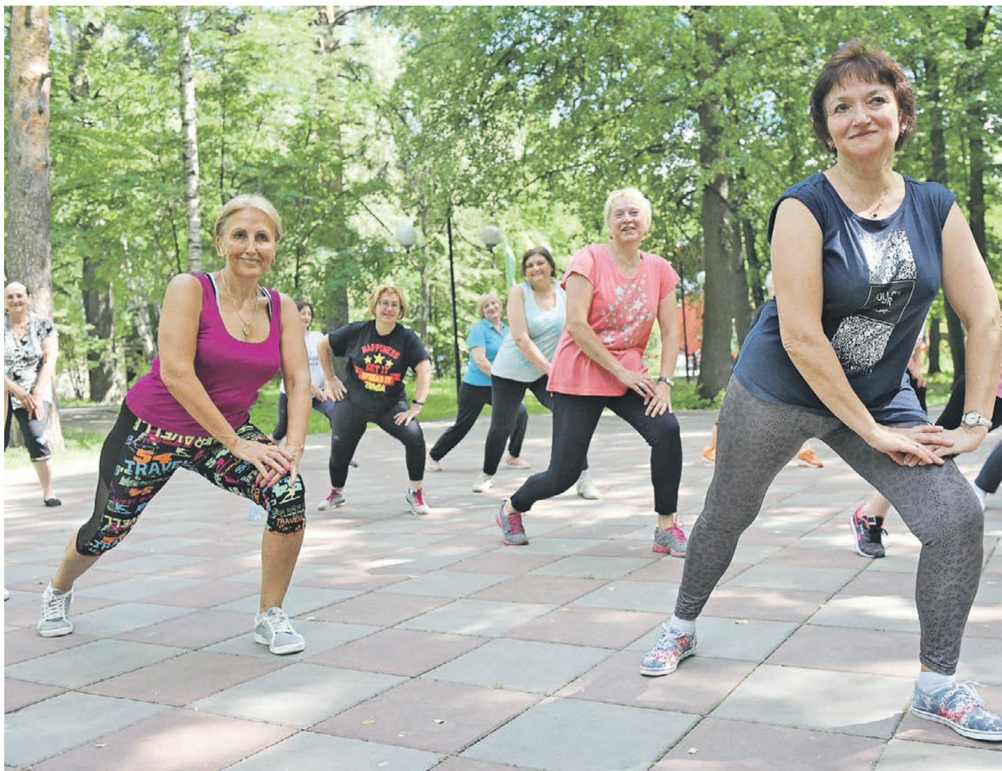
17 июня 2019 года. Мосрентген. Зумба на свежем воздухе этим летом была очень востребована среди участников «Московского долголетия». А в новом сезоне интересных занятий станет еще больше.