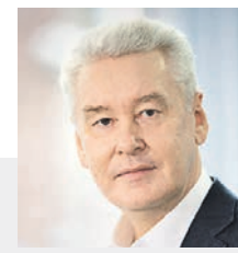
СЕРГЕЙ СОБЯНИН Мэр Москвы

Готовим к запуску МЦД больше 5600 кассиров, контролеров и других сотрудников. Они помогут пассажирам выбрать оптимальный тариф и маршрут с пересадками. Напомню, на Московских центральных диаметрах будут три тарифные зоны и удобная интеграция с городским транспортом.