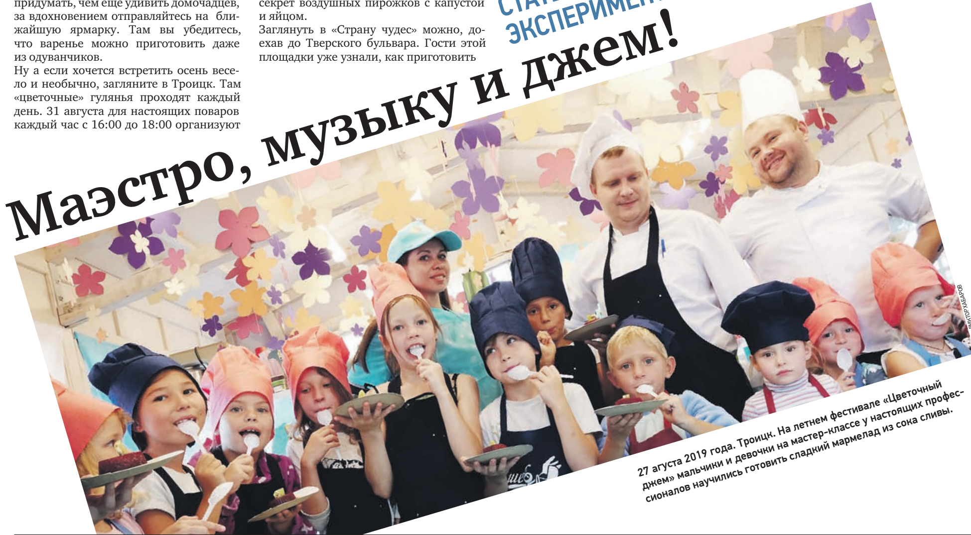
27 августа 2019 года. Троицк. На летнем фестивале «Цветочный джем» мальчики и девочки на мастер-классе у настоящих профессионалов научились готовить сладкий мармелад из сока сливы.

СТАТЬ НАСТОЯЩИМ ПОВАРОМ ПРОСТО. ЭКСПЕРИМЕНТИРУЙТЕ СО ВКУСОМ