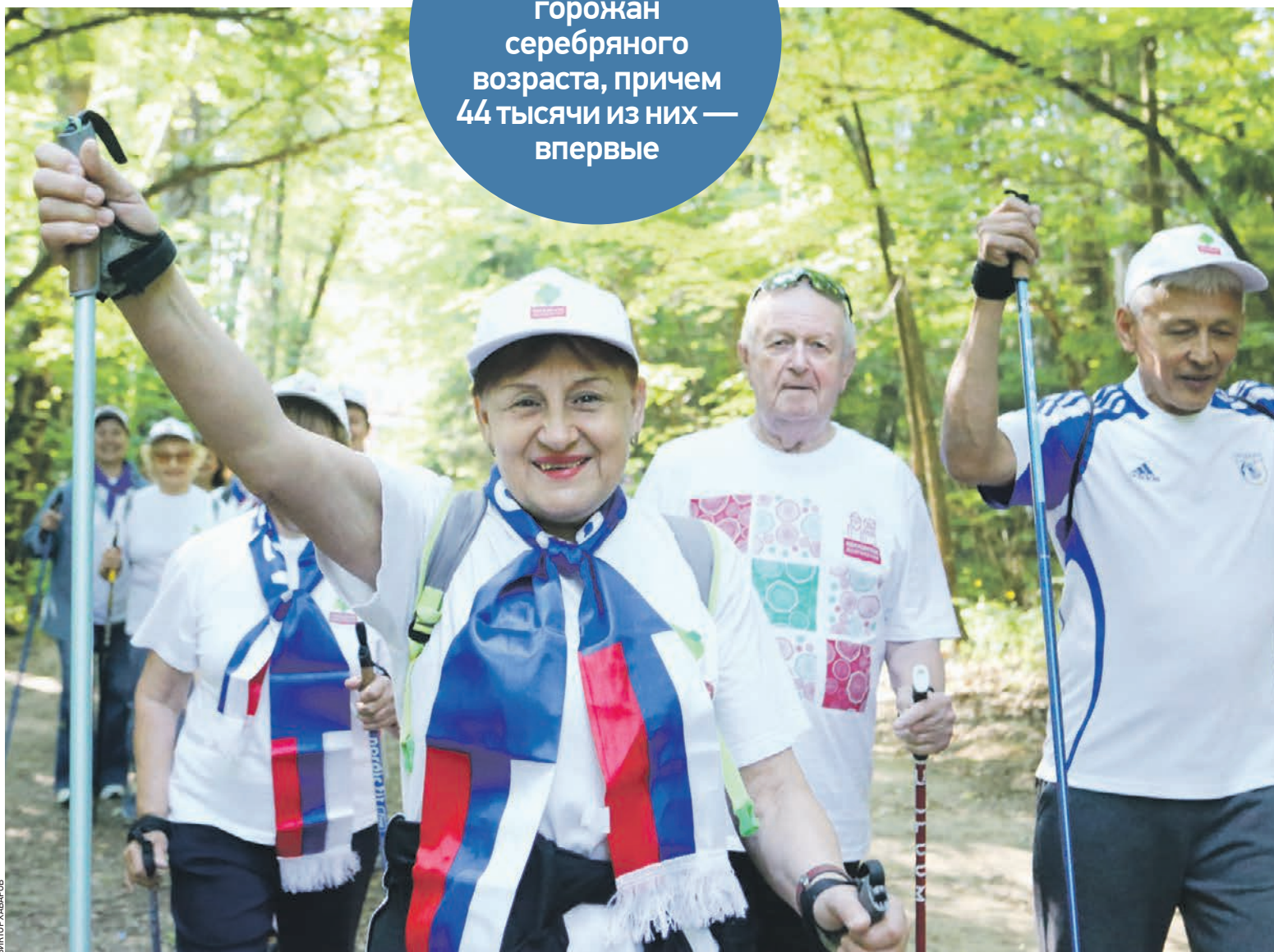
14 июня 2019 года. Троицк. По итогам заседания президиума столичного правительства было принято решение увеличить на две тысячи рублей городской стандарт минимального дохода неработающих пенсионеров.

пар регистрируют брак в 28 столичных загсах в день «трех девяток» — 19.09.2019. В этом году такая дата стала самой популярной. И это несмотря на то, что 19 сентября выпадает на четверг.