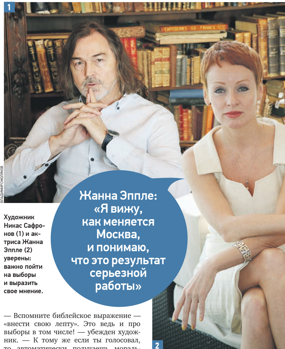
Художник Никас Сафронов (1) и актриса Жанна Эппле (2) уверены: важно пойти на выборы и выразить свое мнение.

Никас уверен, что нужно прийти на выборы, чтобы потом жить с чувством выполненного долга — перед собой, соседями, всем городом.