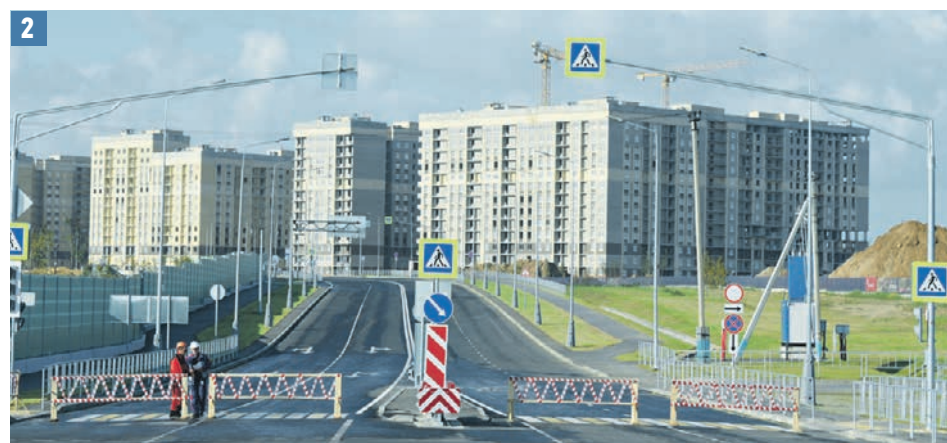
26 августа 2019 года. Щербинка. Мэр Москвы Сергей Собянин общается с жителями городского округа (1) во время своего визита по случаю запуска дублера Остафьевского шоссе (2).

Мэр отметил, что эта поликлиника будет одна из лучших в столице. Помимо того что она построена по новому проекту, в ней будет современное оборудование. — Даже соляная комната и небольшой бассейн для детишек, — сказал Собянин. Изначально поликлинику хотели делать на базе существующего здания. Но, как пояснил мэр, после оценки состояния объекта все же решили строить новый. В этот же день глава города запустил движение по дублеру Остафьевского шоссе. Трасса связала Щербинку с другими районами Москвы — старой и новой. Длина дороги — 4,1 километра. Она проходит