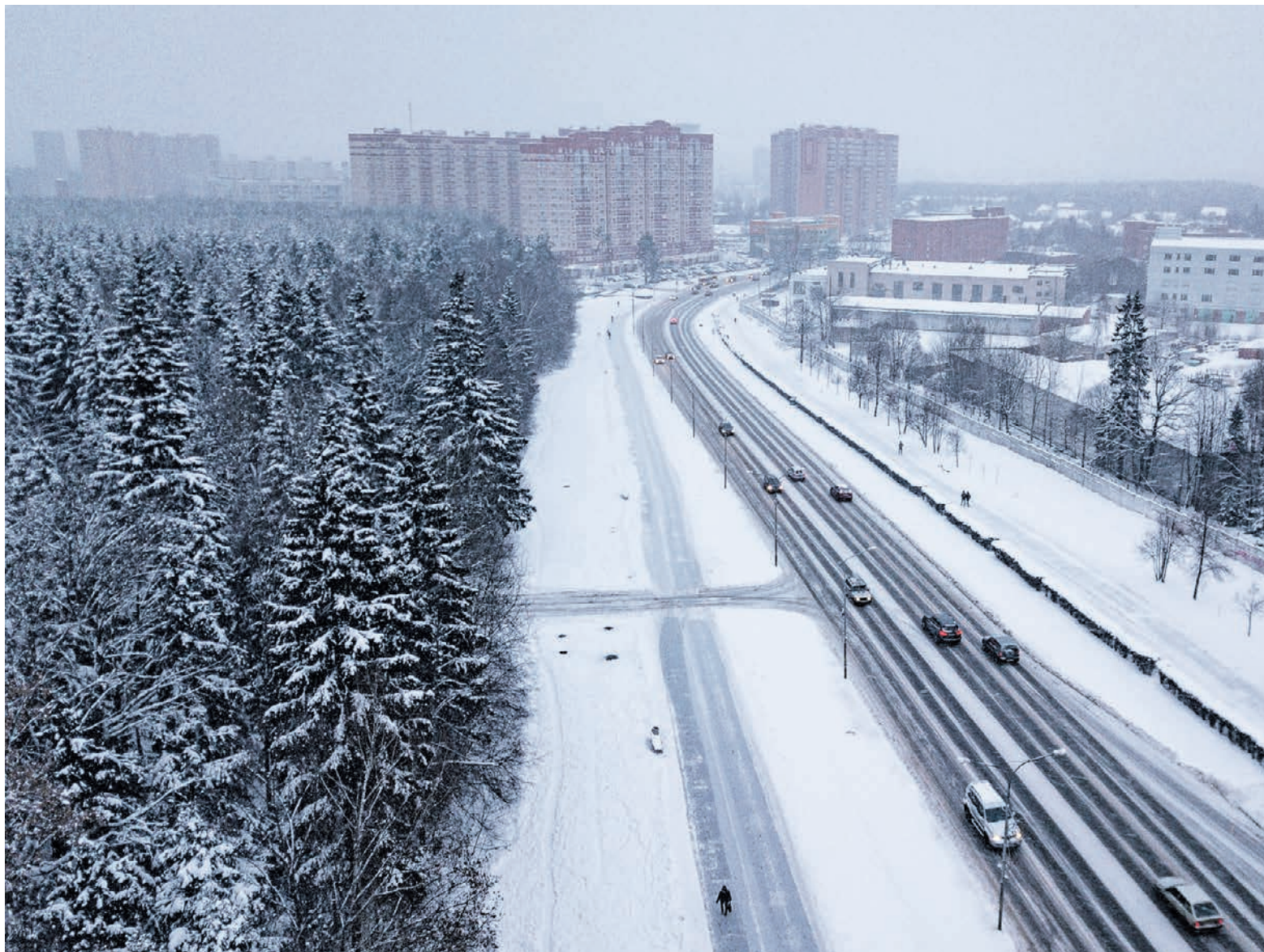
6 января 2019 года. Троицк с высоты птичьего полета. Наглядное доказательство того, что пробок тут стало гораздо меньше.