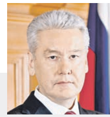
СЕРГЕЙ СОБЯНИН Мэр Москвы

Дорожная сеть в Москве растет с рекордной скоростью. В составе новой трассы Солнцево — Бутово — Варшавское шоссе будет открыто уникальное для Москвы сооружение — совмещенный автомобильный и метротоннель под Калужским шоссе, по которому наряду с машинами пойдут поезда Сокольнической линии метро. Третий строящийся дублер напрямую свяжет МКАД с Коммунаркой и поможет разгрузить Калужское шоссе.