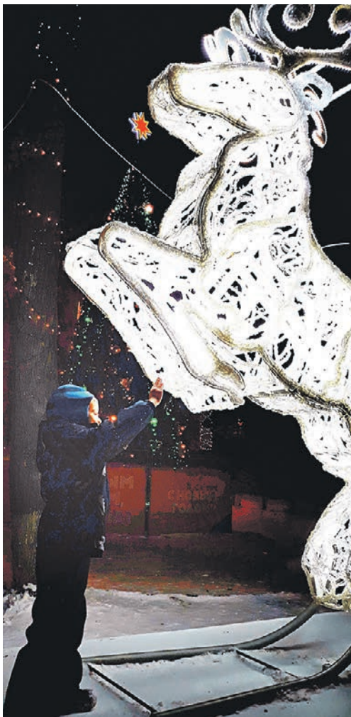
17 декабря 2018 года. «Мишутка загадывает желание волшебному оленю в парке поселка фабрики им. 1-го Мая», — пишет Роман Силетских.