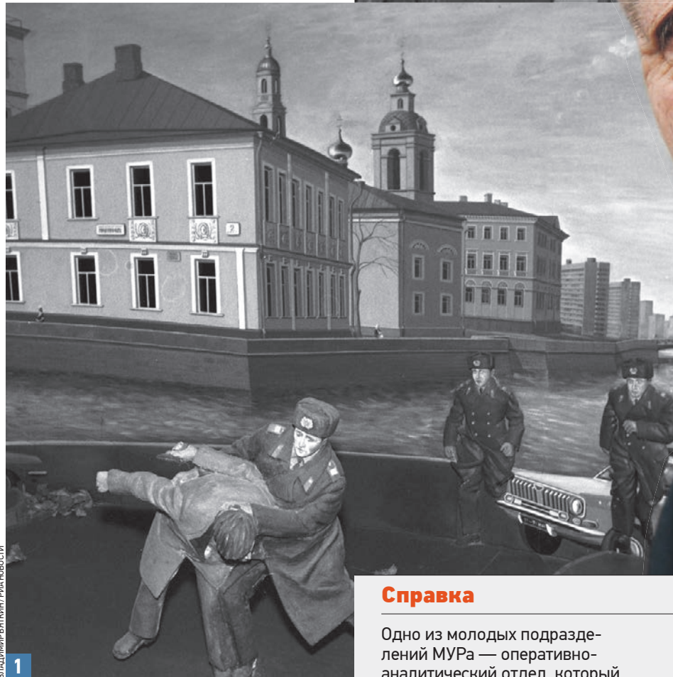
ВЛАДИМИР ВЕЛТИЧКИН / РИА НОВОСТИ

дит в конкретную школу. Начали следить за ребенком — так вышли и на мать. И все эти преступления раскрывали оперативники. Только решение о создании уголовного розыска было принято не сразу, а через год после создания милиции. Бичом стали банковские мошенничества, когда злоумышленники по поддельным документам пытаются получить кредиты. В первое время это получалось. Но вскоре банкиры забили тревогу, и оперативникам пришлось поработать в этом направ-