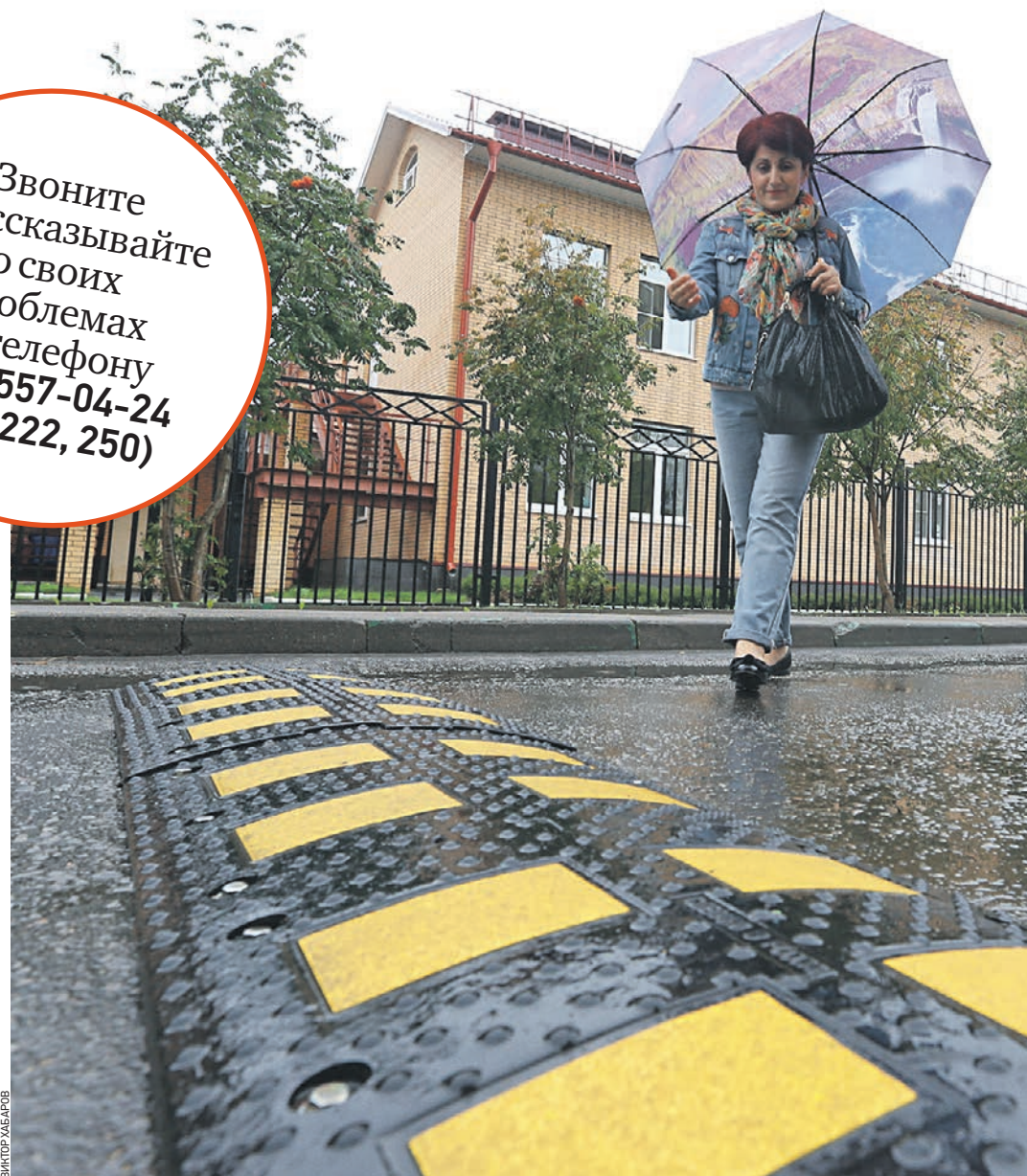
2 октября 2018 года. Рязановское. Переходить дорогу возле сада в поселке Фабрики имени 1 Мая теперь не опасно: после того, как здесь появился лежачий полицейский, лихачить водители перестали.

Звоните и рассказывайте о своих проблемах по телефону (499) 557-04-24 (доб. 222, 250)