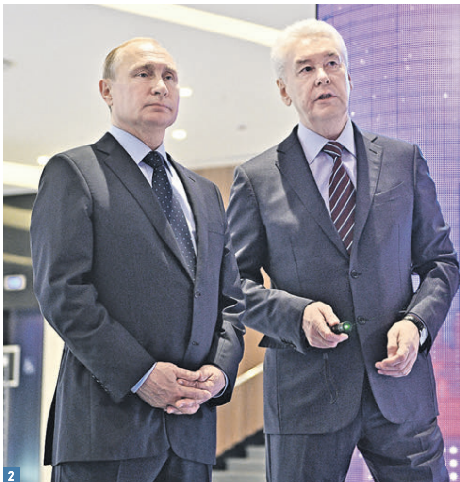
18 июля 2018 года. Москва. Парящий мост стал визитной карточкой парка «Зарядье» (1). Президент РФ Владимир Путин и мэр столицы Сергей Собянин на Урбанфоруме (2).

комфортной городской среды, сделать при этом все районы комфортными, как исторический центр, — сказал президент, подчеркнув, что обновленные пространства помогают развиваться малому бизнесу, улучшают самочувствие горожан, привлекают туристов. Он также добавил, что в столице отлично развивается транспортная инфраструктура: востребовано Московское центральное