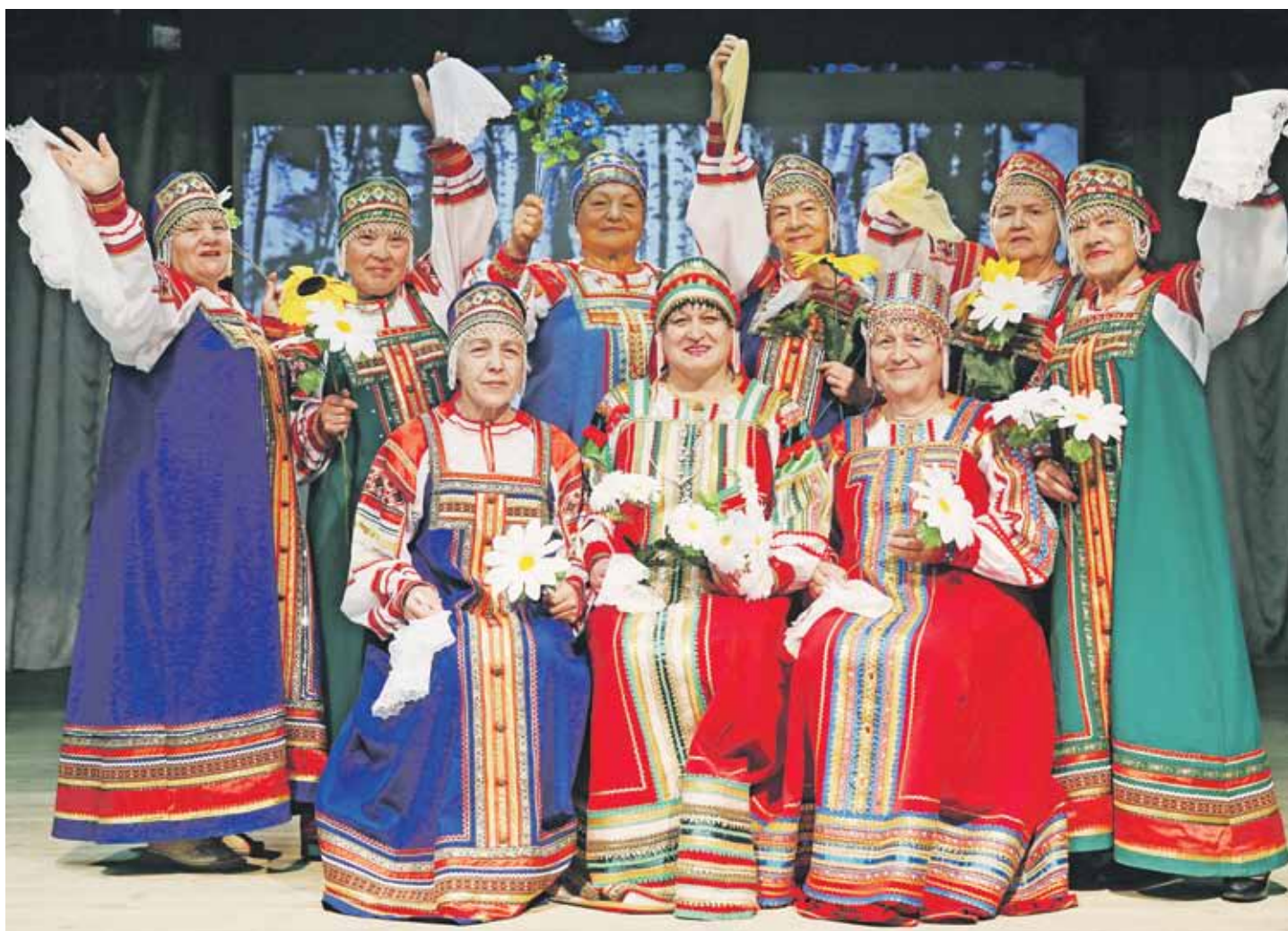
22 июня 2018 года. Рязановское. Участницы творческого коллектива города Москвы, вокального ансамбля ветеранов «Любава» готовятся к выступлению на празднике семьи, любви и верности. Публика их любит, а они всегда стараются вкладывать душу в каждую песню.