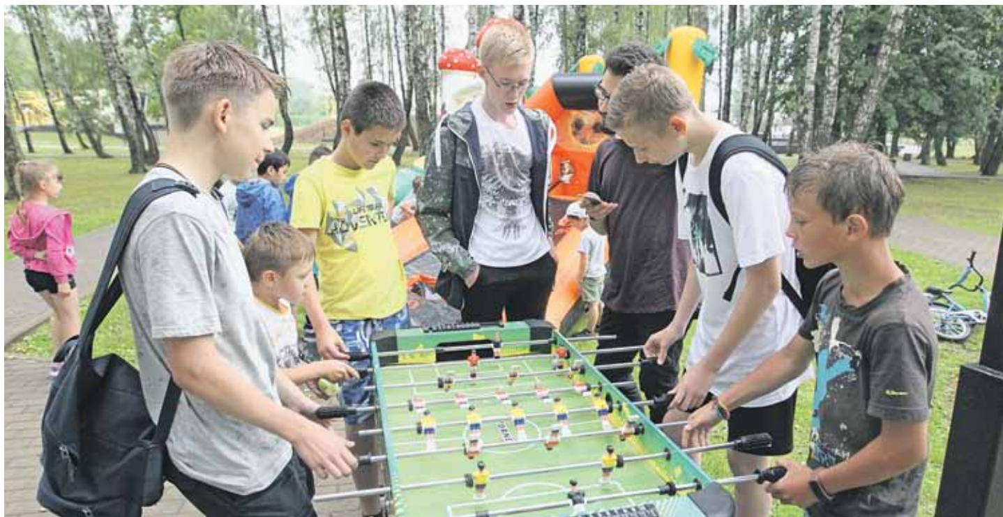
30 июня 2018 года. Краснопахорское. На праздновании Дня молодежи в Парке Победы ребята с удовольствием играли в кикер — настольный футбол. Непогода их спортивному настрою не помешала.