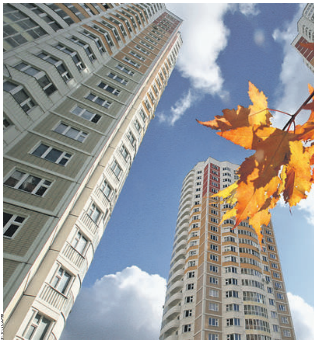
Городские власти твердо пообещали всем обманутым дольщикам, что их проблемы будут решены и люди обязательно получат новые квартиры.

С момента начала работ на площадке было выполнено обследование теплоснабжения от корпусов 1–9 до Марьинской птицефабрики, произведены вос-