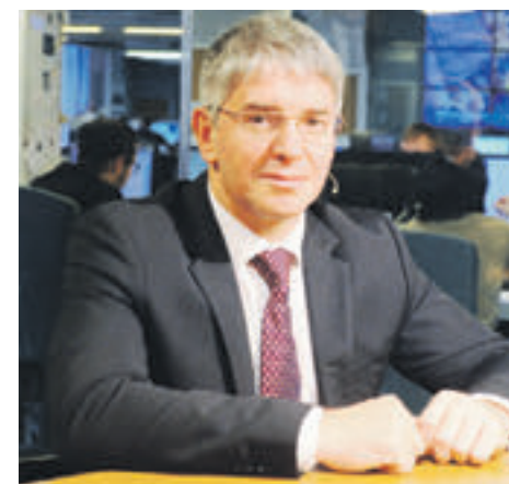
Глава Департамента науки и предпринимательства Москвы Алексей Фурсин.