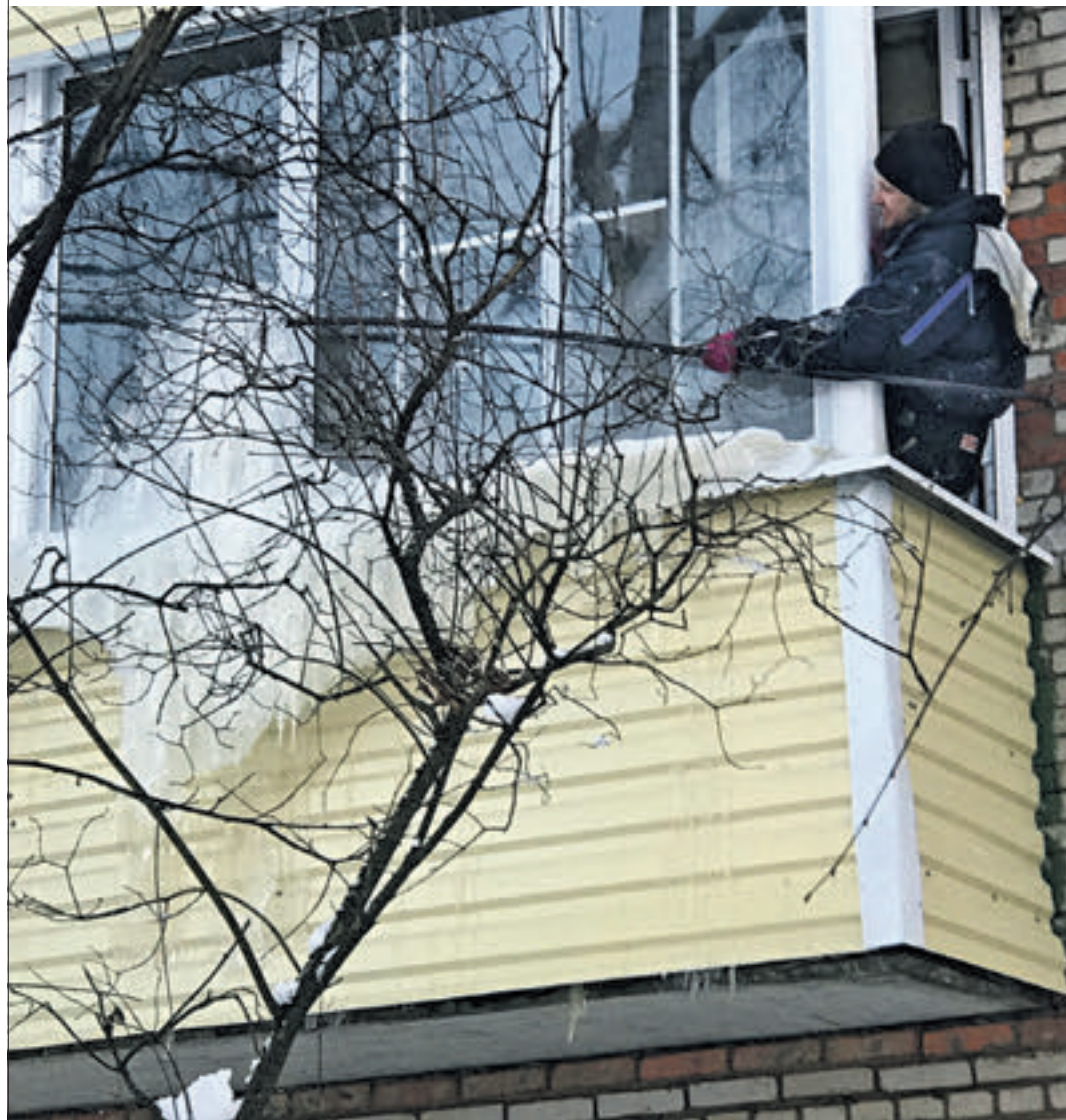
13 февраля 2018 года. Кокошкино. Промышленный альпинист счищает слой образовавшейся наледи с балконов жителей дома № 4 по улице Дачной.