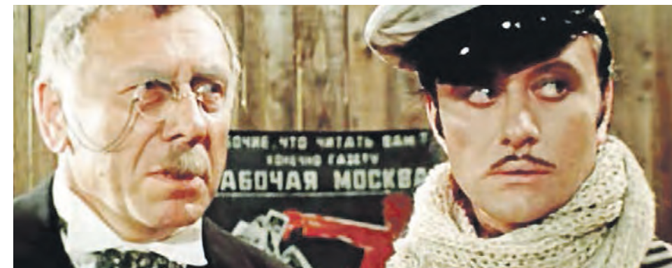
Кадр из фильма «Двенадцать стульев».

Октябрь не радует жителей столицы хорошей погодой, однако богат на культурные и спортивные события. Новомосковичи смогут найти себе занятие по душе: поучаствовать в соревнованиях по карате, послушать выступление камерного хора или познакомиться с тематической книжной выставкой.