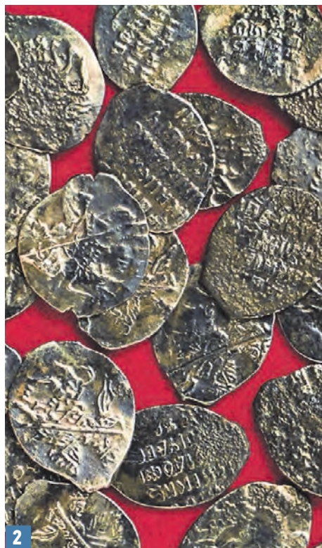
9 октября 2017 года. Обновленная Серпуховская площадь (1). Клад монет XVII века, найденный во время раскопок на Нижней Радищевской улице (2).

— На время ремонта перекрывать улицы полностью не планируется, движение будут ограничивать на одной-двух полосах в зависимости от участка работ, — рассказали в Департаменте капремонта.