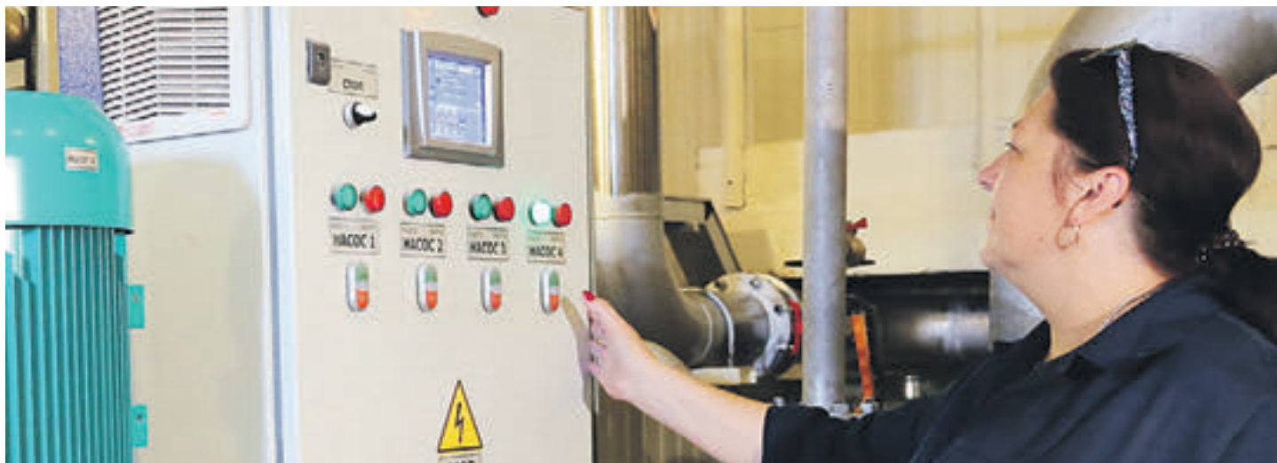
27 сентября 2017 года. Работник Мосводоканала в насосной станции ВЗУ.